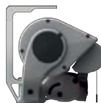
Die Deckenbefestigung der »ERHARDT BS-H«